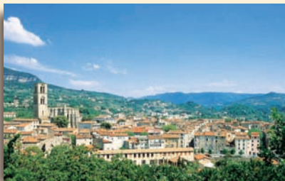
Vue générale de Lodève

C'est un itinéraire de randonnée qui invite à découvrir l'histoire du plateau du Grézac. L'oppidum, implanté sur le puech de Grézac, rappelle l'occupation de l'homme quasi continue jusqu'au haut moyen-âge. Les chemins traversiers (calades), les murs rideaux et terrasses, les cabanes, ou plutôt resserres à outils, témoignent d'une présence humaine importante à partir du xvi e jusqu'au xix e siècle. La géologie, l'archéologie et l'étude de la flore permet-tent de mieux connaître l'histoire et l'évolution de la culture vivrière sur ce territoire. Le retour se fait par le sentier GR® 71, ancienne voie gallo-romaine reliant Le Pertus à Lodève, ancienne cité épiscopale influente, implantée au confluent de la Lergue et de la Soulondres.